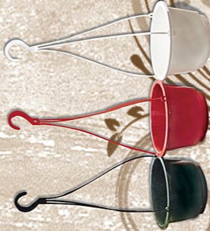
plato # 29